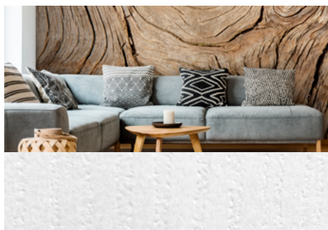
MPI™ 8520 Wallpaper Oak