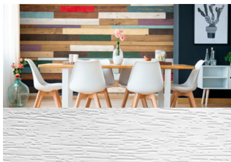
MPI™ 8726 Wall Film Wood