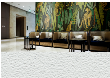
MPI™ 8726 Textured Stone