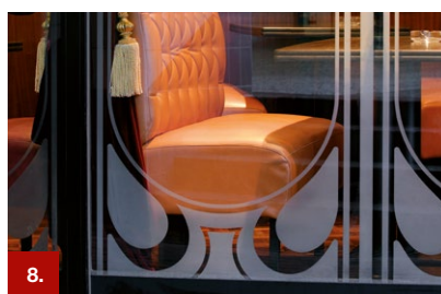
Beispiel 8 ORACAL® 8810