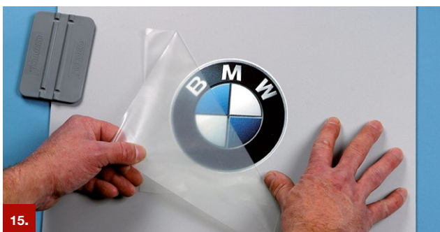
Beispiel 15 ORATAPE® MT95

Die Übertragungspapiere ORATAPE® LT52 und ORATAPE® LT72 sind für Anwendungen nach der Trockenverklebungsmethode geeignet. ORATAPE® MT52 für Anwendungen, die eine mittlere Klebkraft, ORATAPE® LT52 und ORATAPE® LT72 für Anwendungen, die eine außergewöhnlich geringe Klebkraft erfordern. Die halbtransparenten Übertragungspapiere mit einem speziell eingestellten Naturkautschukkleber gewährleisten sowohl die sichere Haftung auf dem zu übertragenden Material als auch die problemlose Entfernbarkeit nach der Übertragung.