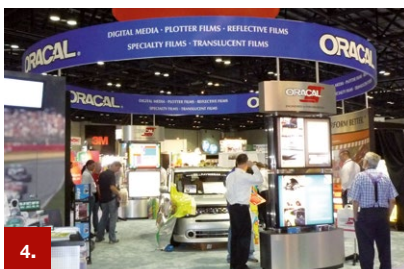
Beispiel 4 ORACAL® 631

Speziell für das Bekleben von Bannern, Banden und anderen flexiblen Untergründen wurde diese Plotterfolie entwickelt. Sie passt sich dem Untergrund optimal an und haftet auch bei sehr hohen Beanspruchungen. Die Folie gewährleistet darüber hinaus eine gute und rückstands-freie Wiederentfernbarkeit. Eine seidenmatte Oberfläche und 24 Farben lassen anspruchsvolle Gestaltungen zu.