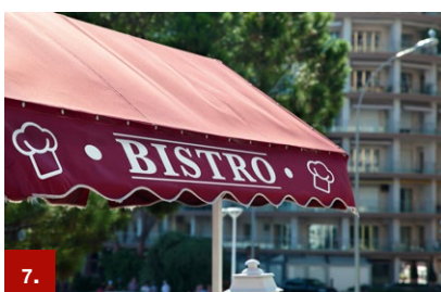
Beispiel 7 ORACAL® 451

Die Diffusor-Folien sind in zwei unterschiedlichen Lichtdurchlässigkeitsvarianten erhältlich.