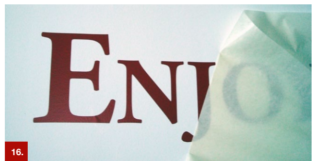
Beispiel 16 ORATAPE® LT52