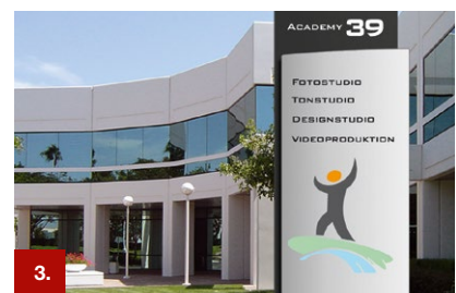
Beispiel 3 ORACAL® 551