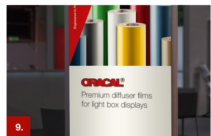
Beispiel 9 ORACAL® 8830