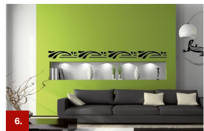
Beispiel 6 ORACAL® 638