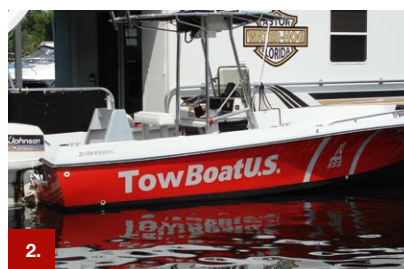
Beispiel 2 ORACAL® 751C