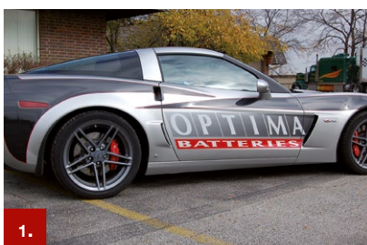
Beispiel 1 ORACAL® 951

Diese Plotterfolie wurde für den kurz- und mittelfristigen Einsatz in der Innen- und Außenwerbung konzipiert. Universelle Verarbeitungseigenschaften sowie 59 brillante Farben in glänzend und 56 Farben in matt machen sie interessant für eine breite Palette an Dekorationsarbeiten. Sie besitzt eine ausgezeichnete Opazität und ist mit ihrem permanent haftenden Solvent-Polyacrylat-Haftklebstoff für eine Haltbarkeit im Außenbereich von bis zu 5 Jahren ausgelegt.