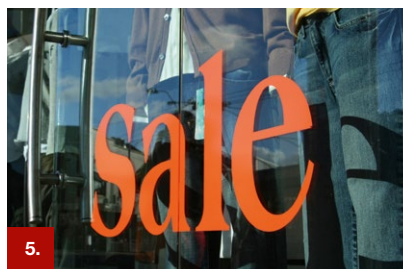
Beispiel 5 ORACAL® 641