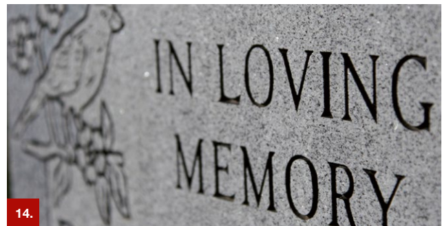
Beispiel 14 ORAMASK® 831/832