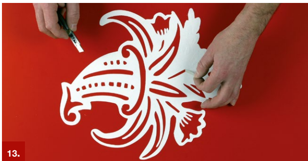
Beispiel 13 ORAMASK® 810

Diese 0,23 mm bzw. 0,35 mm dicken Spezial-PVC-Folien wurden für die vielfältigen Anwendungen von Steinmetzen und Kunstsandstrahlstudios entwickelt. Sie werden bevorzugt für das Sandstrahlen von Glas, Kunststoff und Holz eingesetzt.