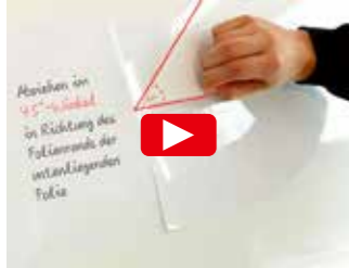
ÜBERLAPPENDE VERKLEBUNG MIT DOPPELNAHTSCHNITT