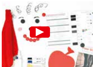
SELBSTKLEBENDE LÖSUNGEN FÜR DAS BÜRO ZU HAUSE