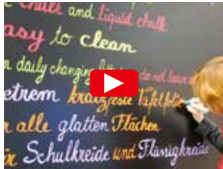
SELBSTKLEBENDE TAFELFOLIEN VON ASLAN – WIR TESTEN UNSERE QUALITÄTSPRODUKTE