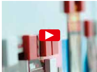
SELBSTKLEBENDE, MAGNETHAFTENDE FERROFOLIEN VON ASLAN – EIN QUALITÄTSVERGLEICH