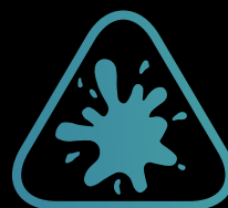
Beständig gegen Flecken